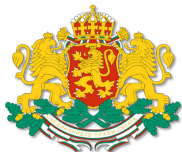
Министерство на регионалното развитие и благоустройството